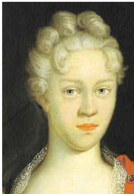
Jugendporträt der Erdmuth Dorothea von Reuß-Ebersdorf, um 1716.

schrritten, dass das Ehepaar Zinzendorf sein „Schloss“ auch beziehen konnte. Längere Zeit dort wohnen konnte man