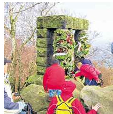
Totenehrung auf der Hohen Liebe, dem „Rütli“ Sachsens.

In den Jahren von 1933 bis 1945 wurden die Ehrungen auf der Hohen Liebe von staatlicher Seite eingeschränkt. Das NS-System kannte nur den Heldengedenktag am 16. März eines jeden Jahres. Am Fuße der Hohen Liebe in Bad Schandau war dieser Tag mit Aufmärschen und Kundgebungen im Stadtpark allgegenwärtig. Für den harten Kern der Mitglieder des Sächsischen Bergsteigerbundes führte der Weg aber nach wie vor zum Gipfel der Hohen Liebe. Nur hier in ihrer Felsenheimat konnten die